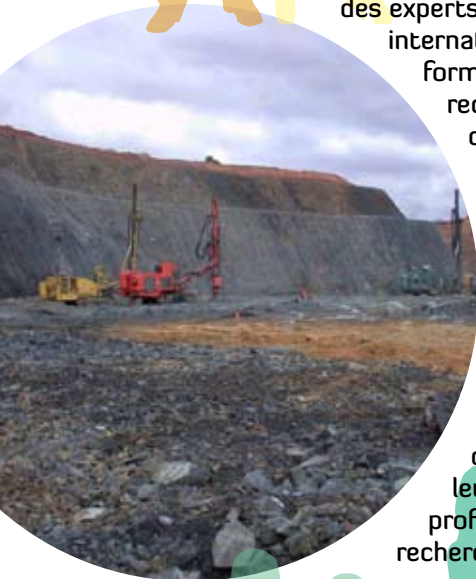
Mine d'uranium, Ranger, Australie

Minéralisation en or, Kalgoorlie, Yilgarn, Australie